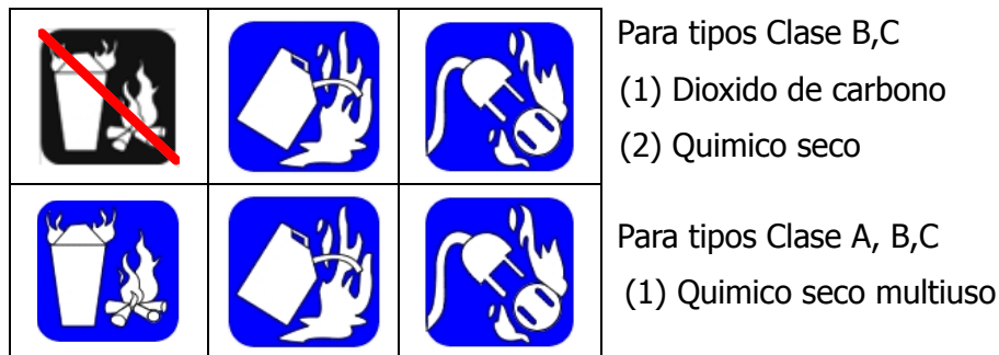
Figura A1- 1. Sistema de marcado.

1.3. Cuando se aplican símbolos a tableros, bastidores de pared, etc. En la cercanía de los extintores, estos deben ser de lectura fácil a una distancia de 4.6 m.