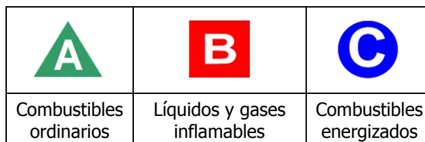
Figura A1- 2. Símbolos en forma de letras.

2.3. Las marcas de símbolos en forma de letras, como se menciona anteriormente, se muestran en la Figura A1- 2. Se debe tomar en cuenta que los extintores adecuados para más de una clase de incendio, deben identificarse con símbolos múltiples colocados en secuencia horizontal.